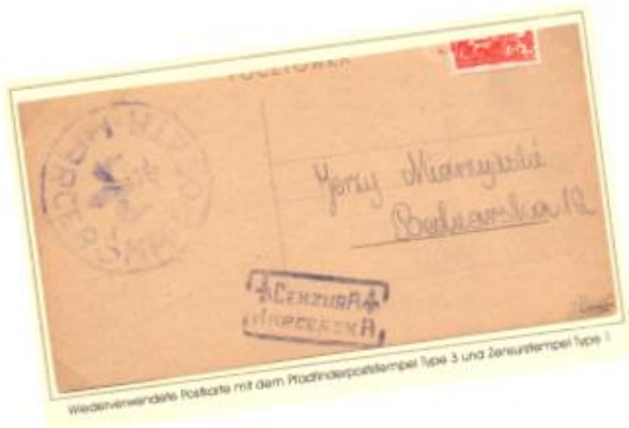
Wiederverwendete Postkarte mit dem Pfadfinderpoststempel Type 3 und Zensurstempel Type 1

Herzliche Grüße und Gut Pfad Harald Rosteck