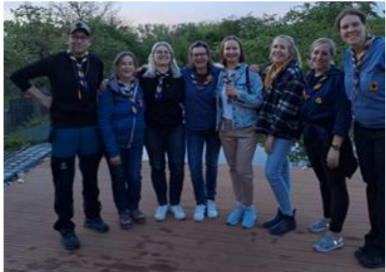
Aufbaugruppe Goldene Horde

Wind oder Regen, das macht den Wölflingen nichts aus! Gemeinsam fingen wir an im Wald ein Tipi zu bauen und wir freuen uns sehr, dass wir dieses Stückchen Wald nutzen dürfen. Die Meute Baghira besuchte mit 10 (!!!) Wölflingen den Bamberger Singewettstreit und erlebte hier zum ersten Mal ein Pfadfinderlager mit vielen verschiedenen Pfadverbänden. Die Wölflinge waren ganz schön aufgeregt und haben ihre erste Nacht in einem Wölflingszelt mit Bravour gemeistert! Auch die Großen knüpften fleißig neue Kontakte und gewannen viele neue Eindrücke.